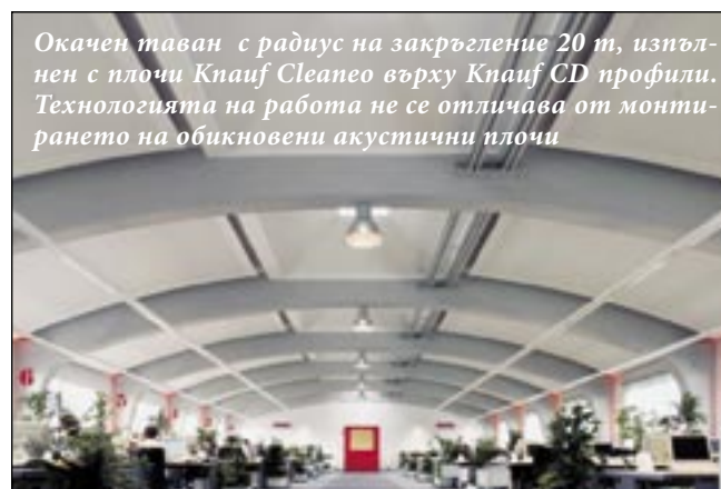
Окачен таван с радиус на закръгление 20 m, изпълнен с плочи Кнауф Cleaneo върху Кнауф CD профили. Технологията на работа не се отличава от монтирането на обикновени акустични плочи